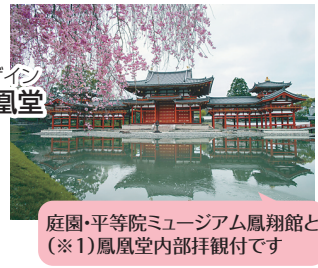
庭園・平等院ミュージアム鳳翔館と(※1)鳳凰堂内部拝観付です