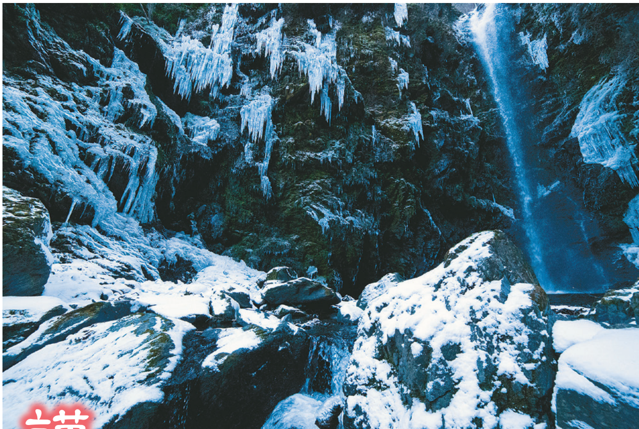
「水瀑」(神山町)