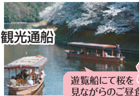
遊覧船にて桜を見ながらのご昼食

出発 徳島 徳島とくとくターミナル 宇治川観光通船 ホテルサンルート西側 8:00 8:20 11:00 秀吉の「醍醐の花見」で有名な 醍醐寺 京つけもの 西利本店 (ショッピング) 徳島とくとくターミナル 徳島駅前 ホテルサンルート西側 14:10 15:30 16:00 16:20 19:25 19:45