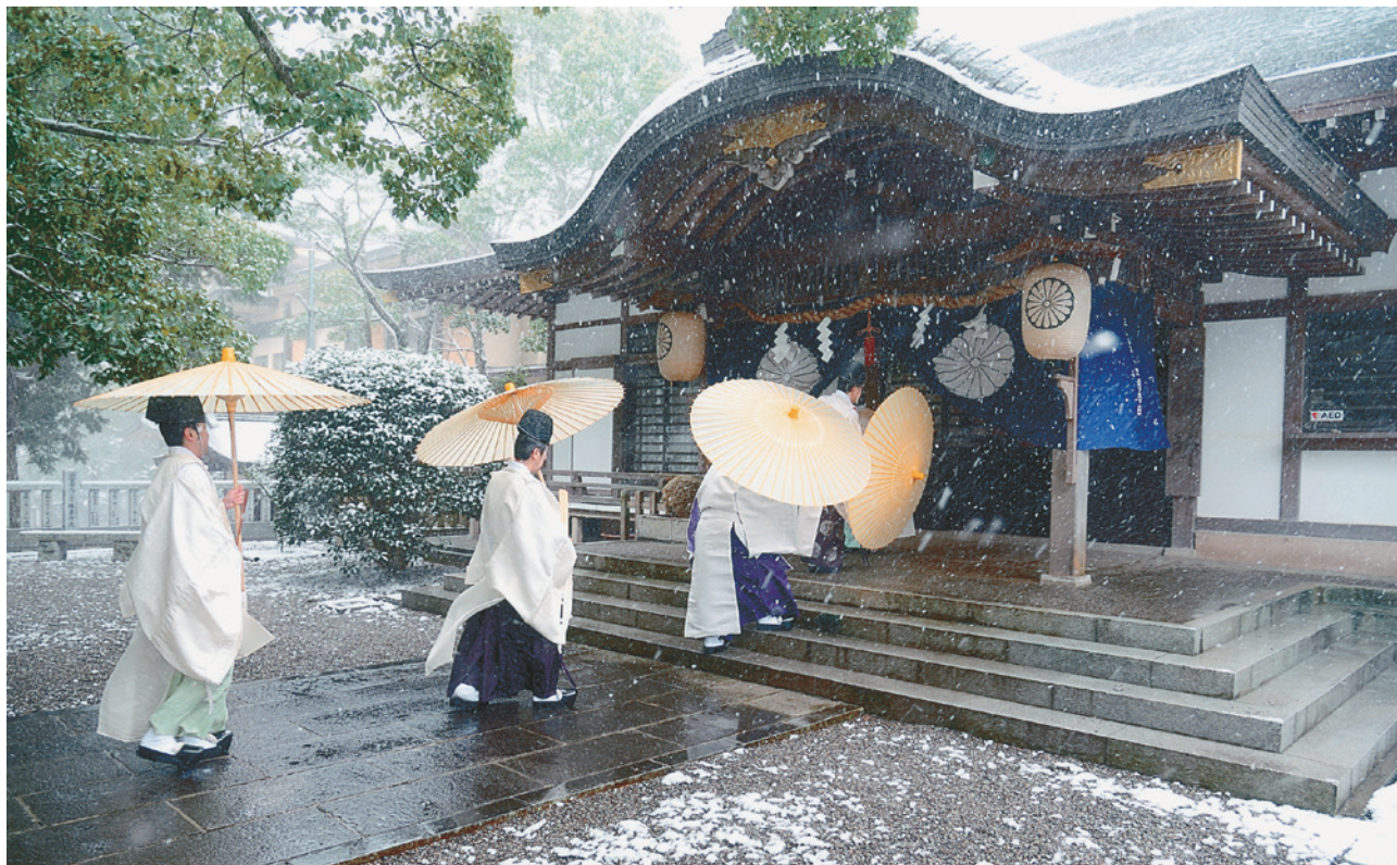
「神事」(大麻町)