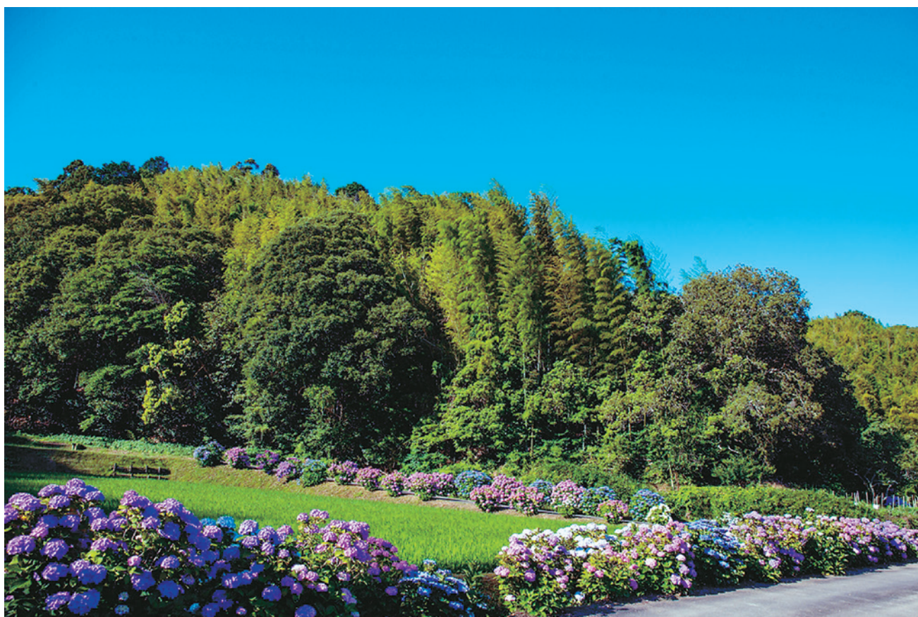
「紫陽花の小径」(小松島市)