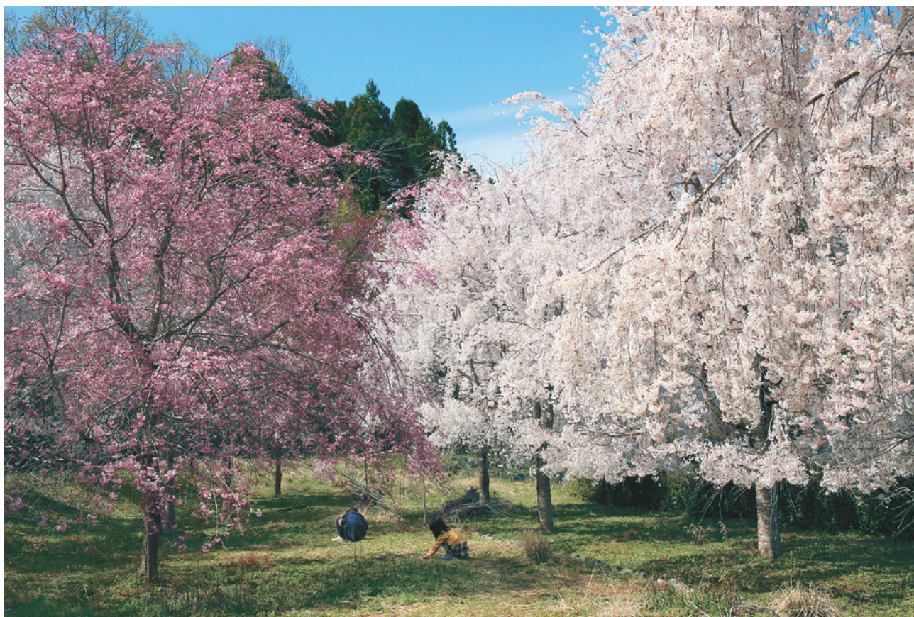
「花びら拾い」(神山町)